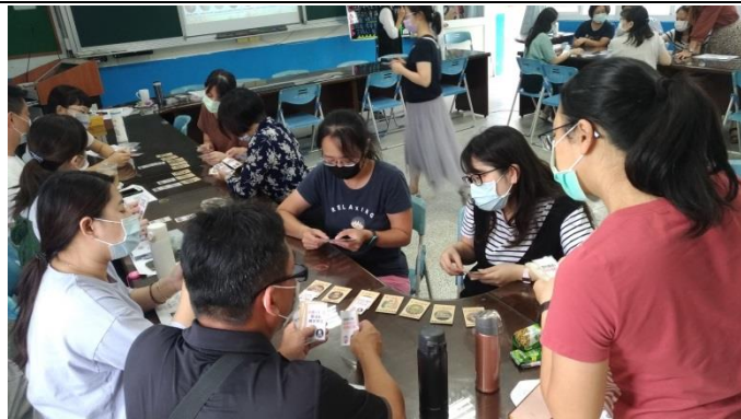
透過桌遊學習性平知能與教學