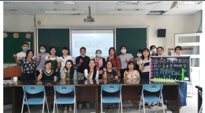
為性平一同努力的夥伴大合影