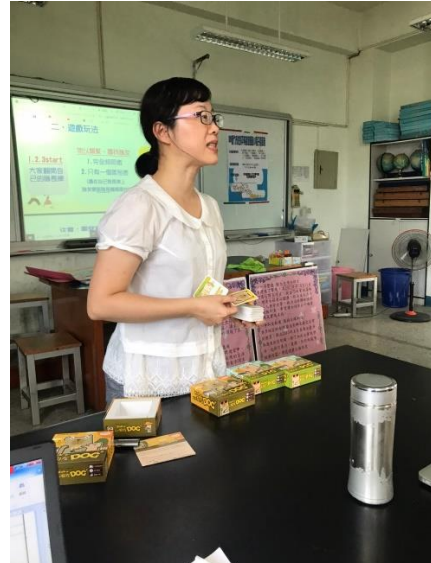
說明：主任輔導員嘉文主任分享看見差異的