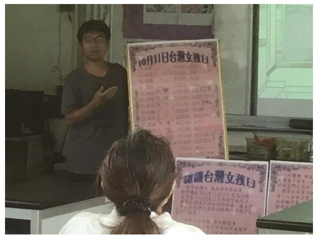
說明：內湖國分分享校內性平教育推廣情況