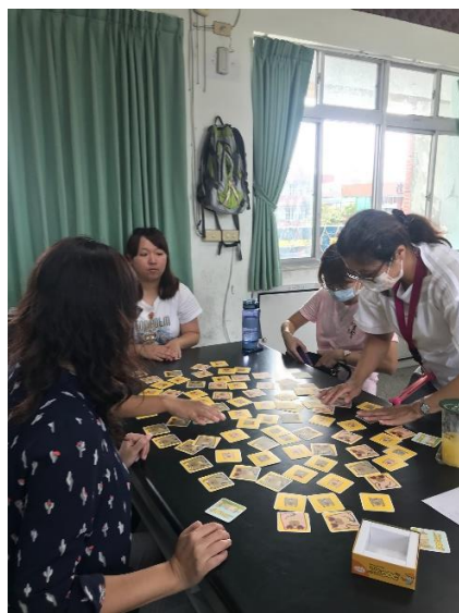
說明：各校老師體驗豬朋狗友桌遊