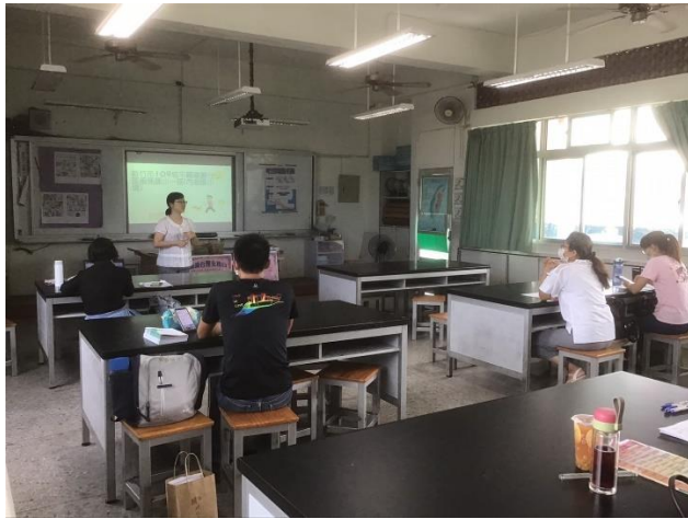
說明：主任輔導員分享性平教育課程學習架構