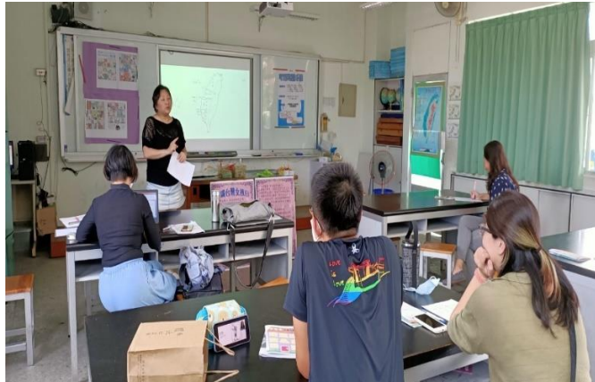
說明：竹蓮國小分享性平教育融入社會領域課程及教學成果