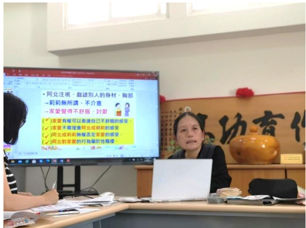
說明：教材「阿北與家愛」的設計使用。