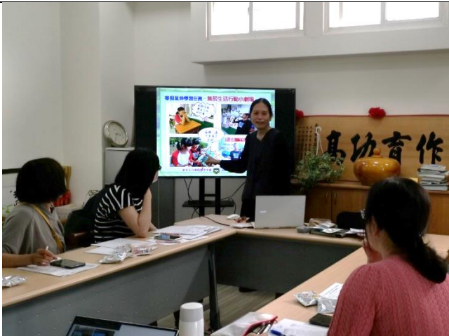
說明：龍主任分享國中生如何設計演出生活小短劇。