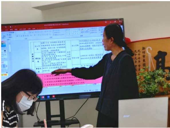
說明：龍主任建議課程學習目標書寫方式。