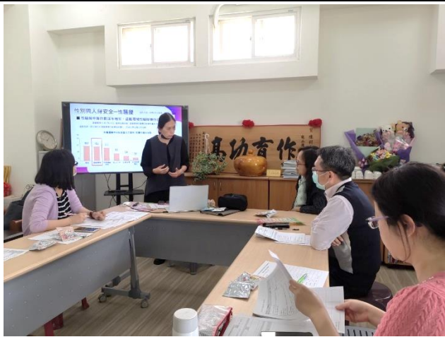
說明：團員專注於課程討論。