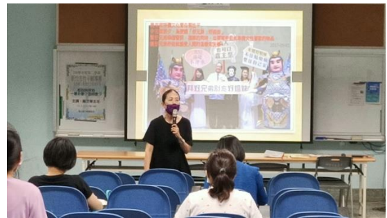
說明：傳統習俗中--祭祀的性別平等教育該怎麼教