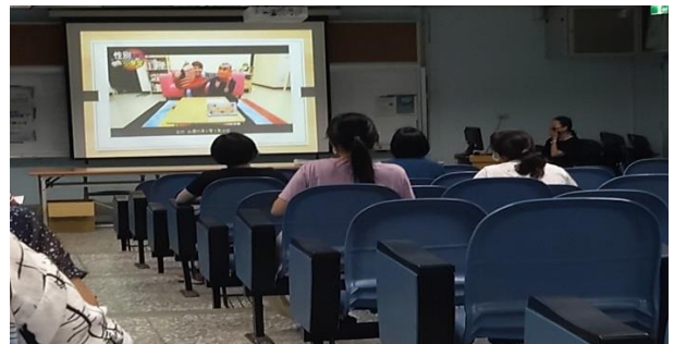
說明：傳統習俗中--抓周的性別平等教育該怎麼教