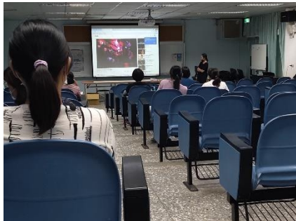
說明：分享性別教育與民俗文化的影片參考資料