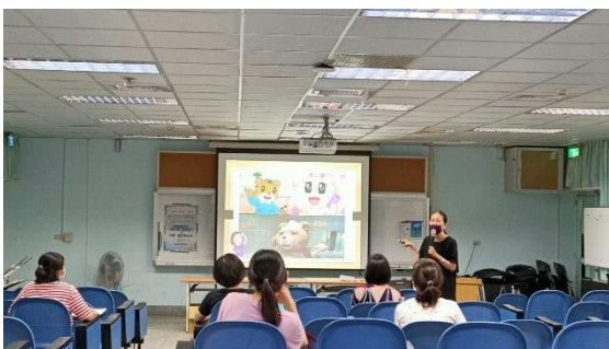
說明：分享性別教育與孩子日常生活文化--電視節目的連結與應用