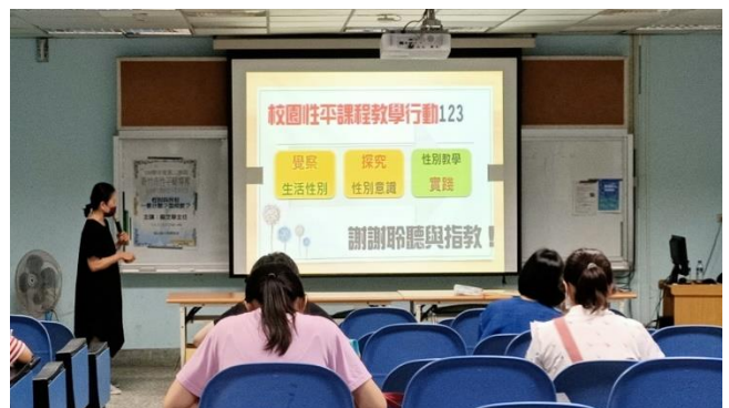
說明：分享校園性別平等課程教學活動三步驟為一 1. 覺察 2. 探究 3. 實踐